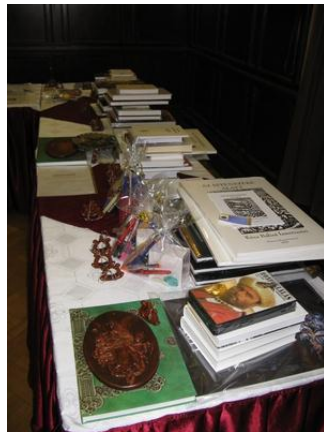
Megrakodva a díjasztal