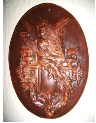
A Magyar Kultúra-díj